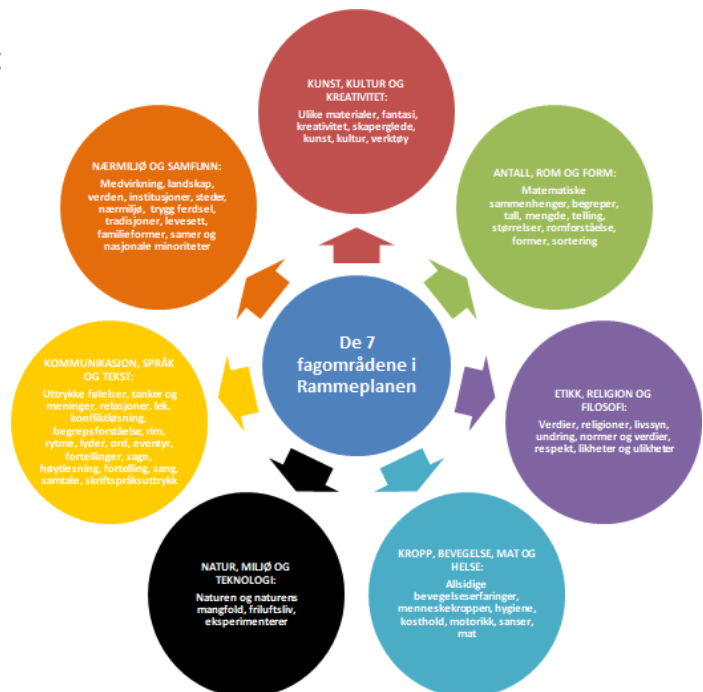
Foto: Bobler som viser de 7 fagområdene